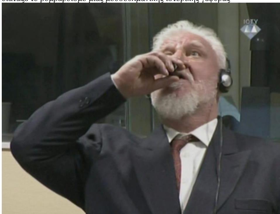
Ο Σλόμπονταν Πράλιακ τη στιγμή της αυτοκτονίας

«Ο Σλόμπονταν Πράλιακ δεν είναι εγκληματίας πολέμου, απορρίπτω με περιφρόνηση την ετυμηγορία σας». Αυτά ήταν τα τελευταία λόγια του καταδικασμένου για εγκλήματα πολέμου Κροάτη της Βοσνίας στην αίθουσα του ΔΠΔ της Χάγης. Είναι 29 Νοεμβρίου του 2017. Αμέσως μετά έβγαλε από την τσέπη του ένα μικρό φιαλίδιο με δηλητήριο και το ήπιε σε ζωντανή σύνδεση σοκάροντας τους πάντες. Είχε προηγηθεί η ανακοίνωση της ετυμηγορίας που επιβεβαίωσε την καταδίκη του σε 20ετή κάθειρξη για εγκλήματα πολέμου και εγκλήματα κατά της ανθρωπότητας που διαπράχθηκαν στη διάρκεια της κροατομουσουλμανικής σύγκρουσης (1993-1994) στο πλαίσιο του πολέμου στη Βοσνία-Ερζεγοβίνη (1992-1995). Ο Πράλιακ υπήρξε στο παρελθόν σκηνοθέτης και με το ξέσπασμα του πολέμου υπηρέτησε σε μονάδα στελεχωμένοι από καλλιτέχνες (!). Καταδικάστηκε γιατί διάταξε το βομβαρδισμό μιας μουσουλμανικής ιστορικής γέφυρας