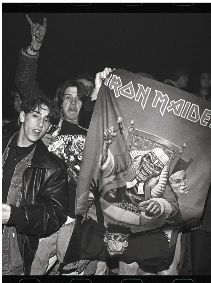
Σεράγεβο συναυλία Dickinson .Μια εικόνα χίλιες λέξεις...

Όμως η πικρή αλήθεια είναι ότι δε ήταν λίγοι αυτοί που έγιναν εθνικιστές. Πολέμησαν πολιτισμικά μέσω της τέχνης τους εχθρούς αλλά και κάποιοι πολέμησαν και κυριολεκτικά. Ακόμα και πανκς...ειδικότερα στην Κροατία. Κάποιοι κάνανε live για να εμψυχώσουν τον κροατικό στρατό, άλλοι πήρανε όμως και τα όπλα. Πιο χαρακτηριστικό παράδειγμα είναι ο Satan Panonski , punk ποιητής δηλωμένος gay και αντιμιλιταριστής που πέθανε στον πόλεμο το 1992 έχοντας γίνει Κροάτης εθνικιστής. Ήταν μία φιγούρα που έμοιαζε με το θρυλικό Αμερικανό πανκ GG Allen. Όπως ο τελευταίος έσπαγε στη διάρκεια του live του μπουκάλια στο κεφάλι του. Πρόσφατα κυκλοφόρησε στην Ελλάδα ένα κομικ για τη ζωή του με τον τίτλο «Satan Panonski (Ο Σατανάς της Πανωνίας)» από το Θείο Τραγί.