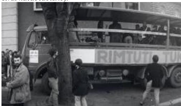
Το φορτηγό των Rimtutituki

Στη Γιουγκοσλαβία πάντως η φιλοπόλεμη στράτευση κάποιων ροκάδων πιθανόν είχε αποτελέσματα. Άλλο να λέει σε ένα νέο να πάει να πολεμήσει ένας σέρβος παπάς και άλλο ένας αναγνωρισμένος ροκάς όπως ο Θορδενίτς που έχει ταυτιστεί στη συνείδηση της νεολαίας με το περιθώριο και την αλητεία. Όμως δεν πρέπει να ξεχνάμε ότι η πλειοψηφία των μουσικών της ροκ αντιστάθηκε και είχε συνέπειες γι' αυτή την επιλογή. Όταν ο Κουστορίτσα έπαιρνε λεφτά για να γυρίσει ταινία οι αρχές δεν έδωσαν άδεια στο αντιπολεμικό συγκρότημα Rimtutituki να κάνει live και έτσι χρησιμοποίησαν ένα φορτηγό σαν σκηνή και περιφερόταν παίζοντας ζωντανά στους δρόμους του Βελιγραδίου (αυτό και αν είναι καταστασιακό).